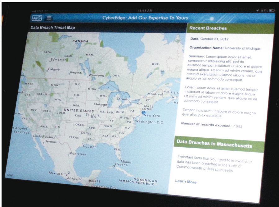
Um exemplo do Mapa de Ameaças de fuga de dados na aplicação CyberEdge para iPad.